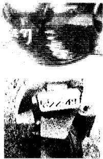
取材からの写真の一部（本人の提供）