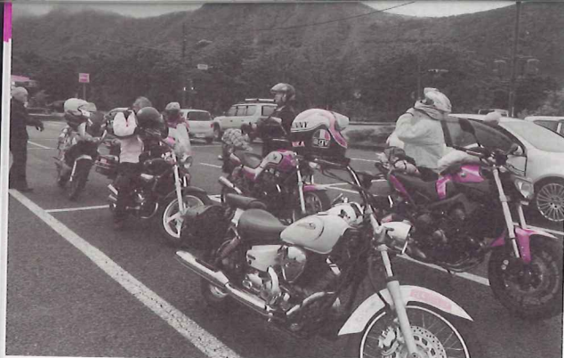
'14年10月5日は偶然にも、ケニー・ロバーツさんをゲストに迎えたライダーイベント「PEACE RIDE」が阿蘇山麓で開催。現地には本誌編集長も東京から駆けつけているとのことで、私たちは前泊地の別府から台風の中走りはじめたのですが……。

加害者のウソの言い分が独り歩きして、目が覚めたときには事故の全面的な過失をなすりつけられていました。なんと、バイクの走行ルートまでねつ造されていたのです。