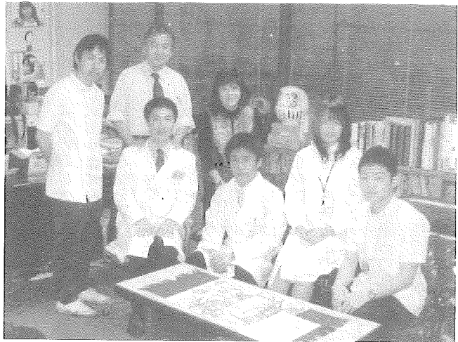
3月6日は、IFMSA-Japan（国際医学部生連盟日本）で活動する5名の医学生が東金病院の研修プログラムに参加。筆者もNPO法人地域医療を育てる会のメンバーとして彼らとの懇談を楽しみました。若い学生さんたちが、地域医療に高い関心を示していることに驚きました。